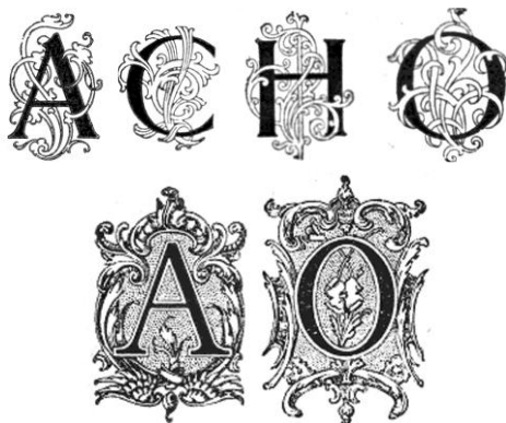
Figura 5: tipografia das grandes capitulares mais presentes e marcantes da revista no período de 1924 a 1931.