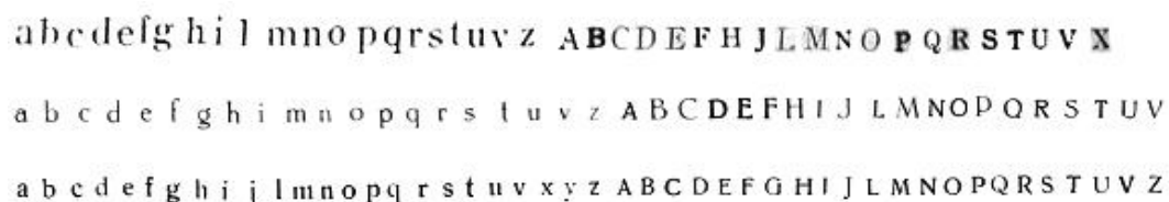
Figura 1: Txt1, Txt2 e Txt3

A figura 1 mostra as 3 tipografias. Há uma similaridade anatômica entre a primeira e a terceira. A segunda caracteriza-se por uma relação entre a altura “x” e as hastes menores que as duas outras, com aproximadamente 45% da altura da haste.