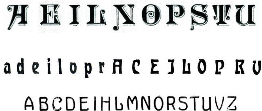
Figura 6: tipografia de alguns títulos do período estudado.

Foram encontradas 27 tipografias de títulos diferentes. Há uma média regular entre os que são somente em caixa alta e os que são caixa alta e baixa. Suas anatomias são bastante diversificadas (fig. 6).