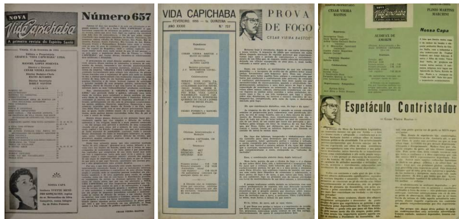
Figura 18: Editoriais das edições 657 (1955), 737 (1956) e 751 (1957), respectivamente.