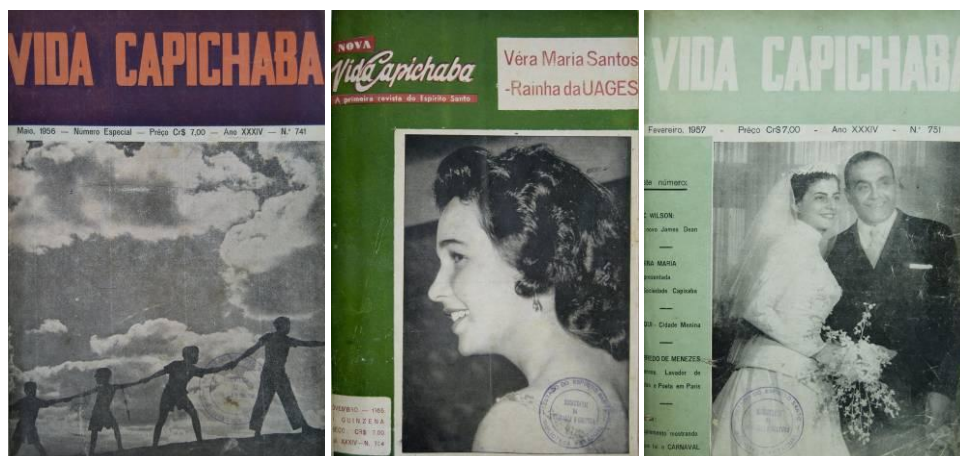
Figura 17: Capas da edições de nº734 (1955), nº741 (1956), nº751 (1957), respectivamente.

Em agosto de 1955, Vargas suicida-se e a contagem dos exemplares da revista retoma a numeração interrompida em janeiro de 1951 permitindo afirmar uma relação direta com a entrada e saída de Getúlio Vargas na presidência do país.