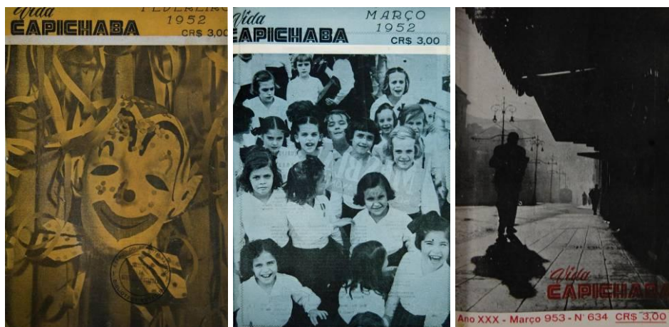
Figura 15: Capas das edições 621 (1952), 622 (1952) e 634 (1953), respectivamente.

Em janeiro de 1952 as capas começam a passar por uma espécie de normatização, com fotografias maiores, geralmente com sangria, acompanhadas por uma barra horizontal de cor variante que continha uma espécie de logotipo para o nome da revista. Esse padrão se manteve até 1955, salvo poucas exceções.