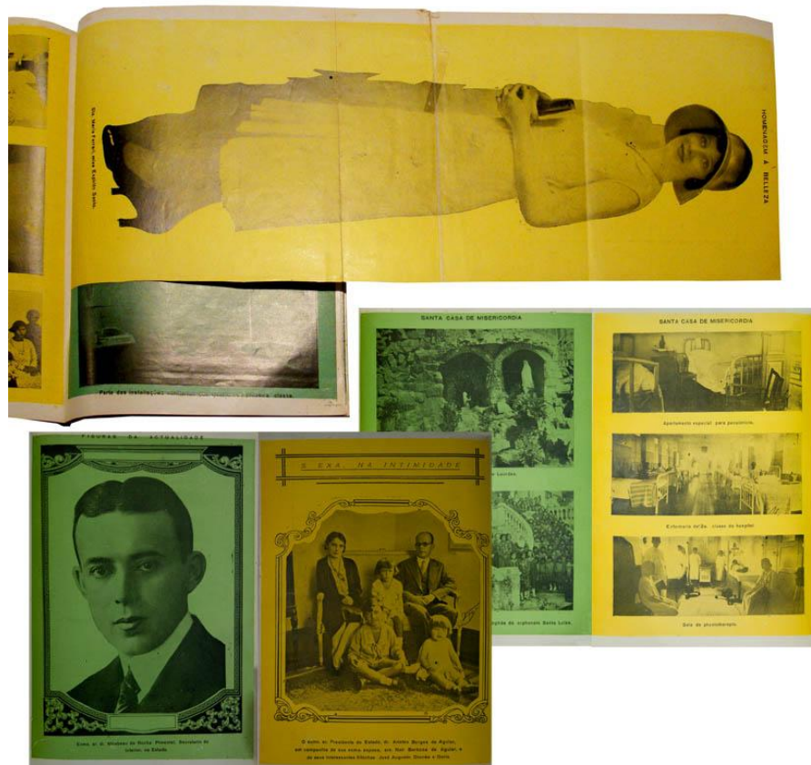
Figura 8: Páginas da edição 233 (1930).