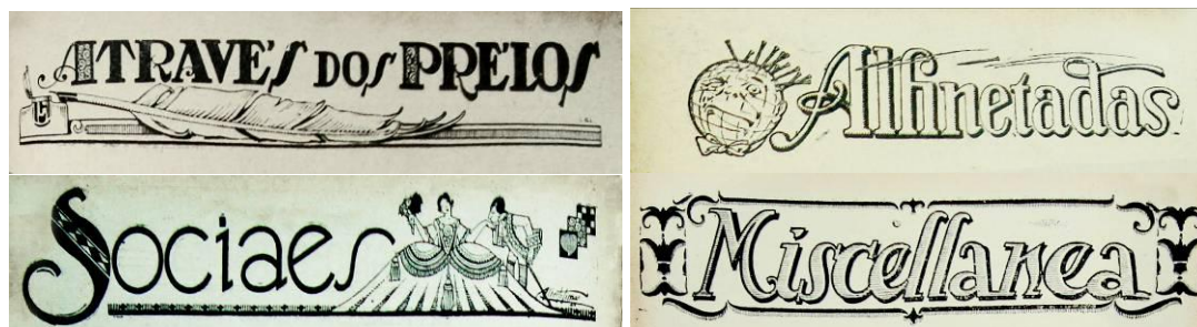
Figura 3: Exemplos de vinhetas que abriam as seções da revista na década de 1920.

Impressa em 1923 na tipografia da Imprensa Estadual do Espírito Santo, com tiragem de 1000 exemplares em “formato a” (figura 4), a primeira edição da RVC - subscrita “Revista Quinzenal Ilustrada” em seu expediente, custava 500 réis por unidade. Seus textos eram geralmente diagramados em três colunas, o que permitia “maior flexibilidade na inserção de imagens e anúncios [...] com uso de entrelinha mais justa em proporção ao tamanho da fonte, prevalece o uso do corpo 9/8,5” (Paiva et al. , 2011, p.25). O uso de ornamentos, fios e grafismos é recorrente, separando colunas e blocos de texto, ornando poesias acompanhadas por belas ilustrações. As seções da RVC eram anunciadas por vinhetas, resultantes do arranjo entre letras desenhadas e ilustrações e impressas através de clichê, que variavam periodicamente tornando a revista graficamente dinâmica.