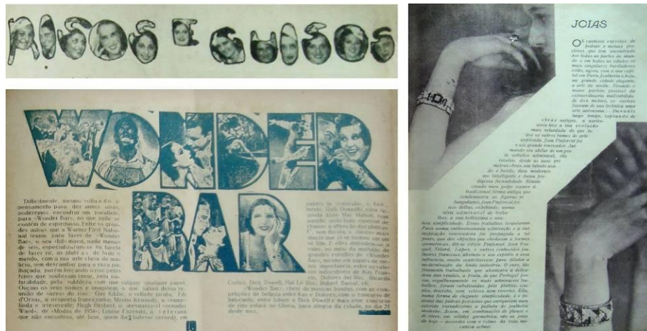
Figura 10: Acima e à esquerda, as vinhetas “Risos e Guisos” e “Wonderbar” nas edições 318 (1932) e 342 (1933), respectivamente. À direita, página da edição 372 (1934).

disseminação cultural norte-americana, originando uma seção de título auto-explicativo: “Cinema”.