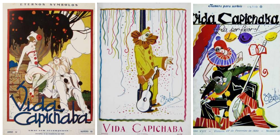
Figura 4: Capas das edições 62 (1926), 162 (1929), 216 (1930).