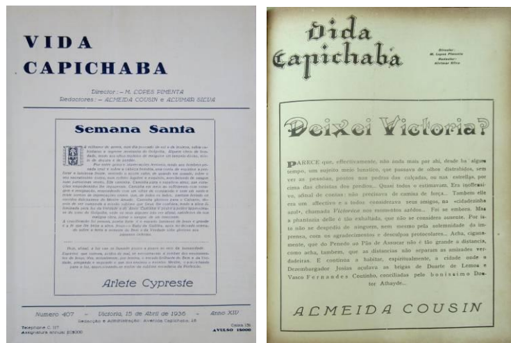
Figura 12: Editoriais das edições 407 (1936) e 509 (1940), respectivamente.

do texto editorial, que volta a ser diagramado de forma mais sóbria, anunciando uma tendência visual do impresso.