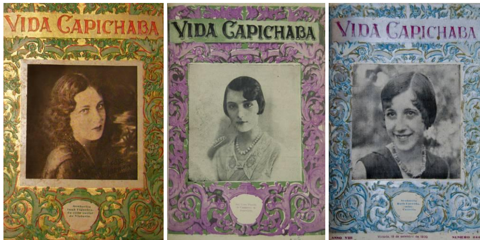
Figura 5: Capas das edições 221 (1930), 233 (1930) e 244 (1931), respectivamente.

O alto custo dos clichês dobra o preço da segunda edição, lançada em maio de 1923. Após a terceira edição a RVC deixa de circular por dois meses, também por motivos financeiros, retornando apenas em agosto do mesmo ano.