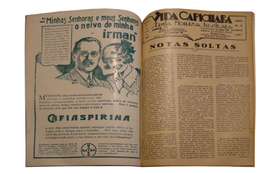
Figura 6: Segunda capa e editorial da edição 129 (1928).