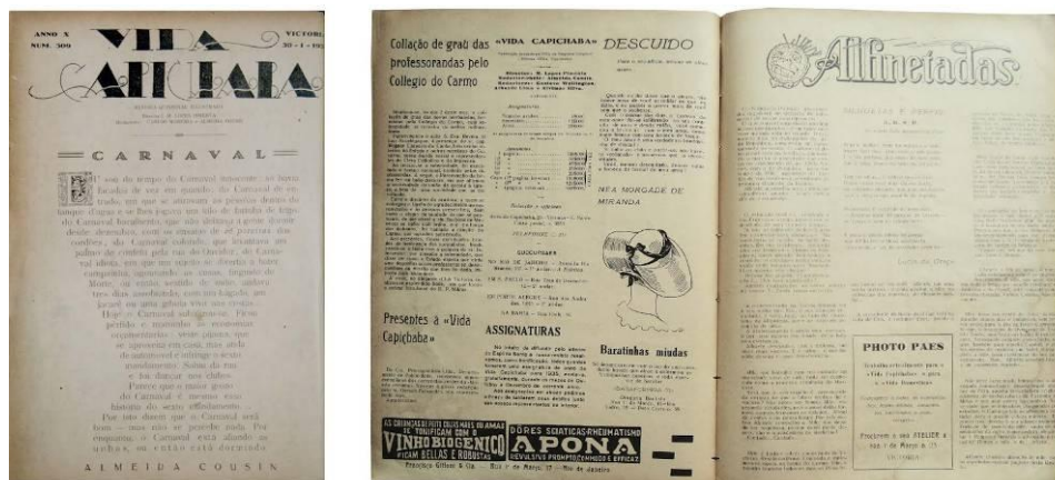
Figura 9: À esquerda, página do editorial da edição 309 (1932). À direita, páginas da edição 378 (1934).