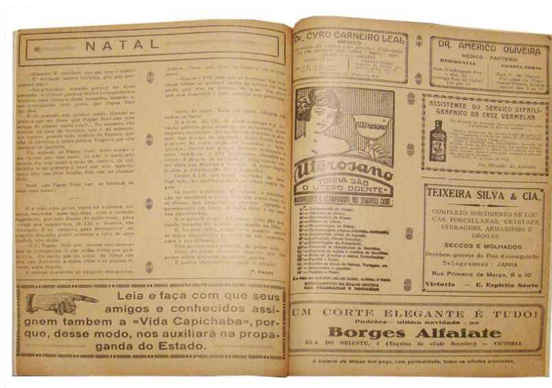
Figura 7: Páginas (em papel jornal) da edição 207 (1929).