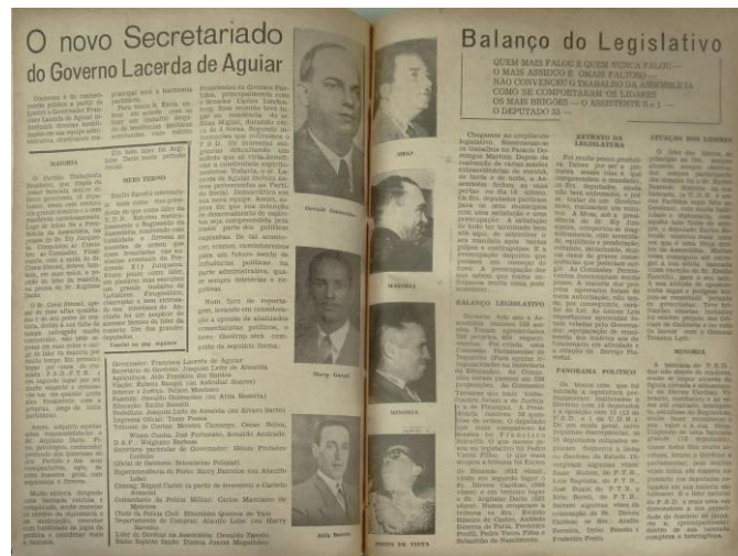
Figura 16: Imagem de páginas da edição nº 736 diagramada em quatro colunas.

observar que a capa mudou, a mancha gráfica passou a comportar até quatro colunas, sem dúvida, visualmente, uma clara e grande mudança. (DUTRA et al. , 2011, p.8)