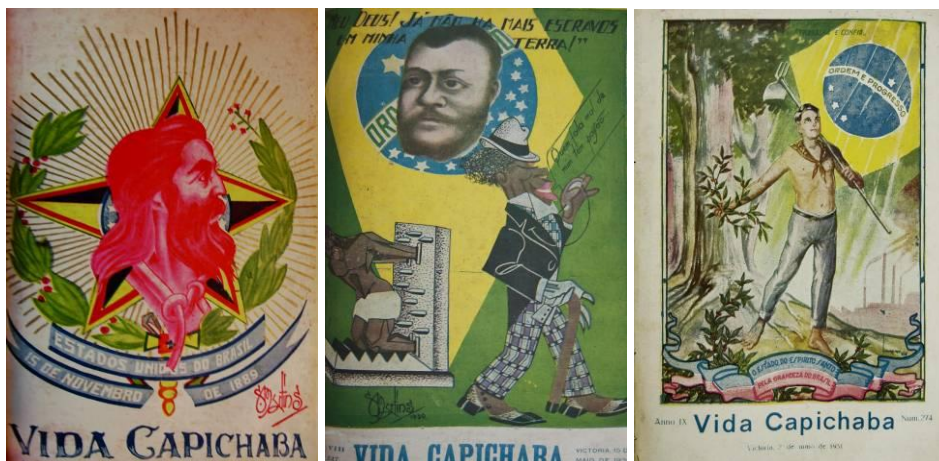
Figura 13: Capas da edições 224 (1930), 227 (1930) e 274 (1931), respectivamente.