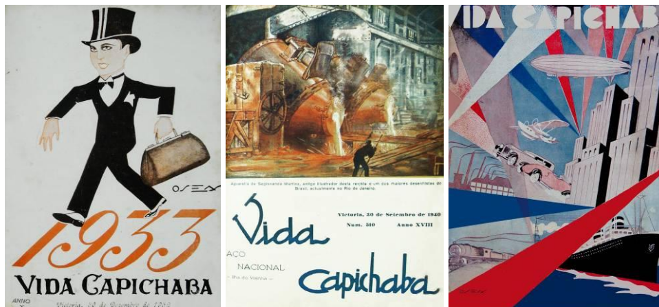
Figura 11: Capas das edições 331 (1932), 339 (1933) e 510 (1940), respectivamente.