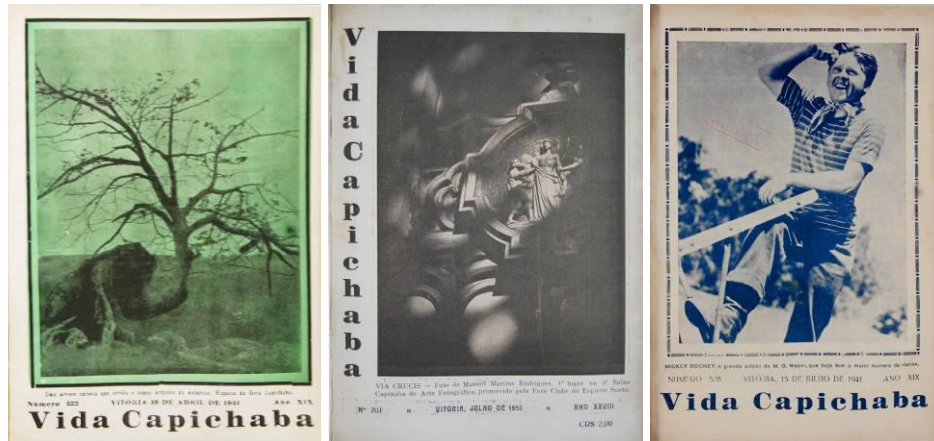
Figura 14: Capas das edições 528 (1941), 533 (1941) e 701 (1950), respectivamente.